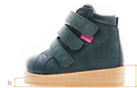
Skrót z zejściem bez przekolebania