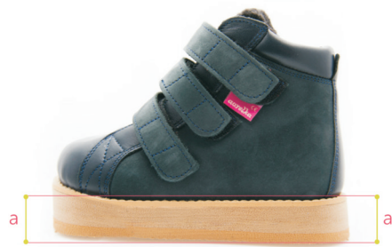
Skrót po całości bez przekolebania