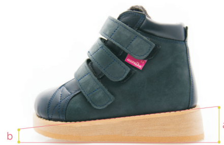
Skrót z zejściem i przekolebaniem