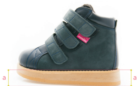
Skrót po całości z przekolebaniem

Na życzenie klienta, skrót może być wykonany bez przekolebania, a z zachowaniem tej samej wysokości zarówno w tyłostopiu, jak i w przodostopiu.